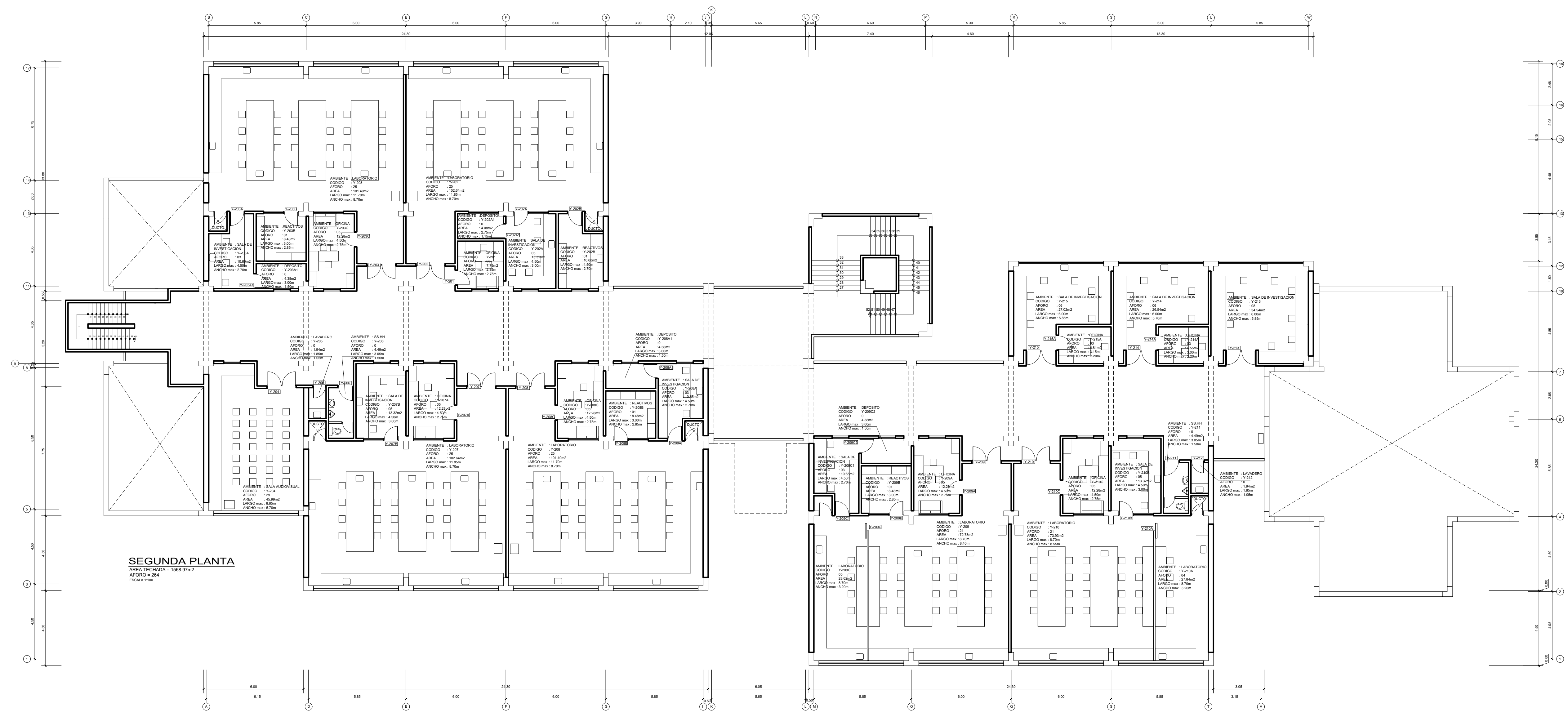
SEGUNDA PLANTA AREA TECHADA = 1566.97m 2 AFORO = 264 ESALA 1/100